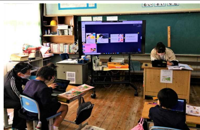
【授業参観⑤道徳 (2年生)】