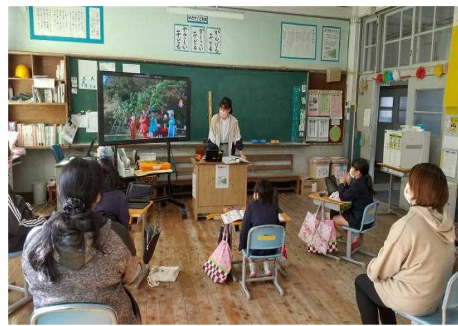
【授業参観①道徳 (2年生)】

○ 12月6日(火)に行われた授業参観は、全学年「道徳」の授業を行いました。12月4日～10日は、「人権週間」です。人権について考える一つの機会として行いました。2年生は、「あなたってどんな人？」(個性の伸長)。3・4年生は、「れいぎ正しい人」(礼儀)。5・6年生は「くずれ落ちただんボール箱」(親切, 思いやり)を行いました。今回の学習をとおして、人との関わり合いで大切にしたい気持ちをしっかり考え、これからの生活に生かしていきたいとの思いを持つことができましたようでした。