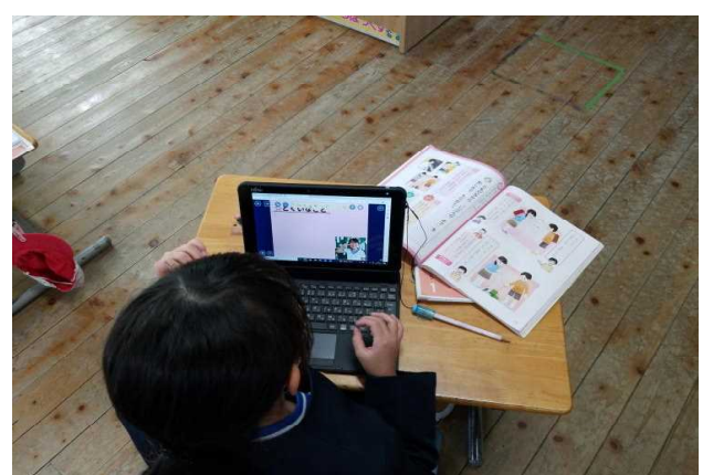
【授業参観④道徳 (2年生)】