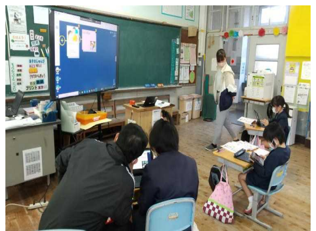
【授業参観②道徳 (2年生)】