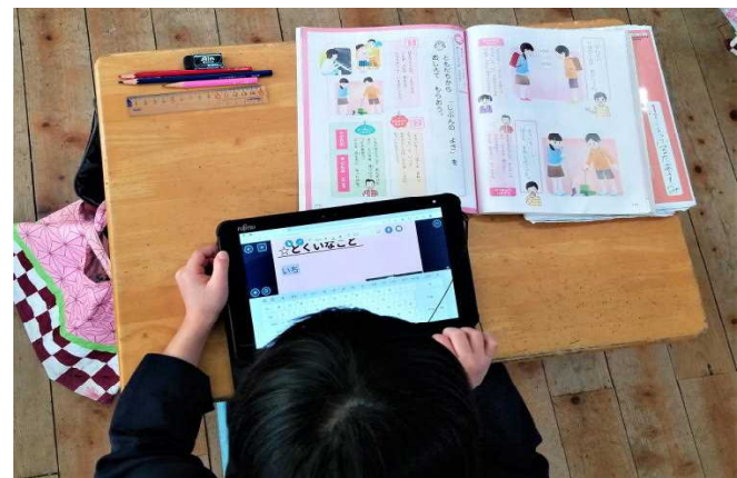
【授業参観③道徳 (2年生)】