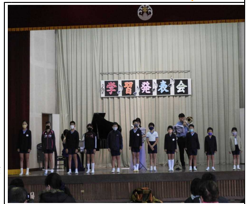
【昨年度の学習発表会より】

○場所 牛根小学校体育館 今年も、コロナウイルス感染症対策のため、内容を見直し、縮小して実施する予定です。現在、児童15名が発表に向けて、一生懸命練習中です。 ぜひ、御鑑賞ください。