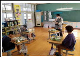
【3・4年交流給食の様子】