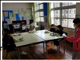
【1・2年交流給食の様子】