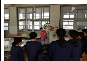
【柘原大根の重さは?】