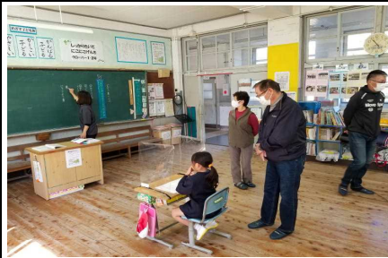
【1年：国語(じどうしゃくらべ)】

11月1日(日)から7日(土)の「地域が育む『かごしまの教育』県民週間」では、保護者・地域の皆様方の御参加をいただき、子どもたちの頑張る姿を参観していただきました。ちょぴり緊張しながらも、にこにこ笑顔で満足気な様子の子供たちが印象的でした。