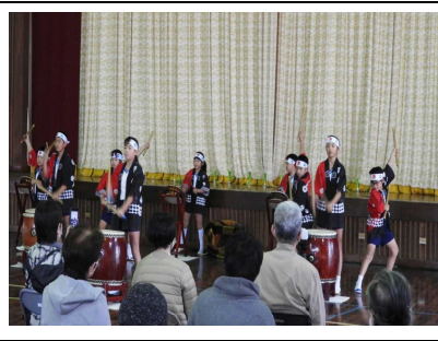
【全児童「ぶち合わせ太鼓2020」】