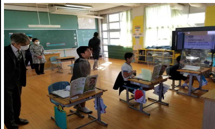
【3・4年：理科(太陽の光を調べよう)】