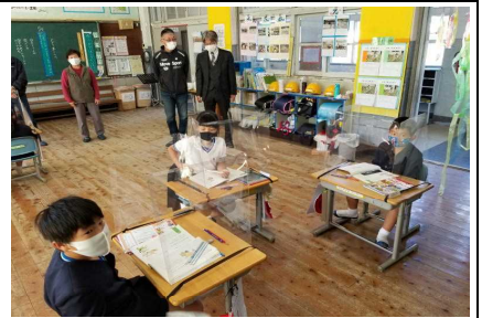
【2年：国語(そらだんにのってください)】