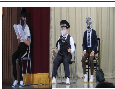
【3・4年「やまねこおことわり」】