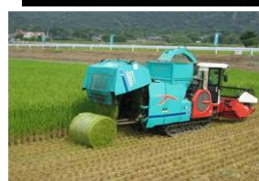
飼料作物収穫・調製用機械