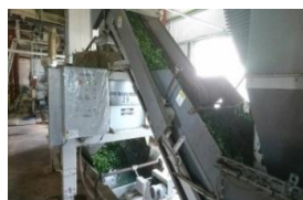
生葉洗浄脱水施設