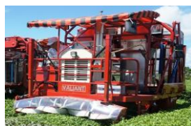
摘採機能付き除灰機