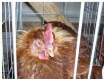
肉冠のチアノーゼ