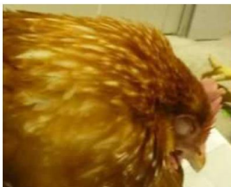
沈うつ・羽毛の逆立ち