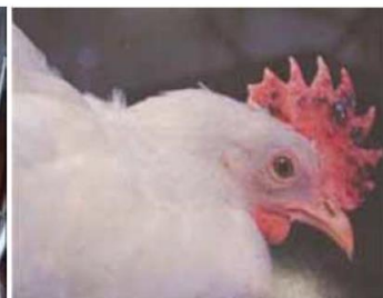
肉冠の出血・壊死