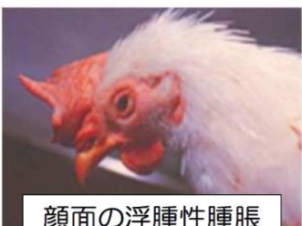
顔面の浮腫性腫脹