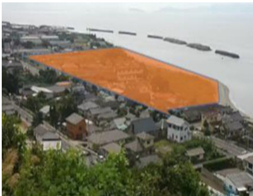
図 計画地位置（※オレンジ色範囲内の敷地）