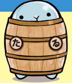
市公式イメージキャラクター「たるたる」

「第2期垂水市まち・ひと・しごと創生推進計画」に位置付けているすべての事業が対象です。まずはお気軽にご連絡ください。