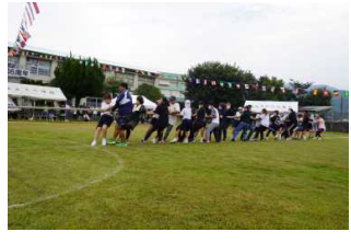
【6年親子種目：綱引き】