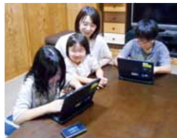
▲家庭学習で端末を活用している様子

保護者から「今はタブレットは文房具であり、昔では想像できない学びの大きな変革に驚いている」という声をよく伺います。だからこそ、保護者の理解を深め、互いに連携しながら、牛根小らしいGIGAスクール構想を推進していく必要があると考えています。これからも保護者のいろいろな声を受け止め、子供たちのためのよりよい実践に結び付けていきます。