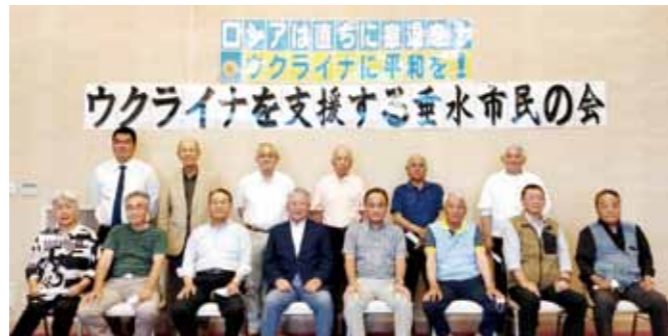
▲ウクライナを支援する垂水市民の会の皆さん

この度は、短期間にもかかわらず、多くの方々のご理解・ご協力を賜り誠にありがとうございました。