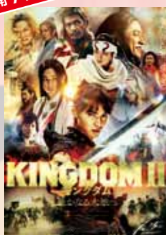
キングダム2 遥かなる大地へ