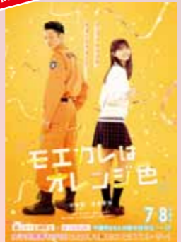
モエカレはオレンジ色