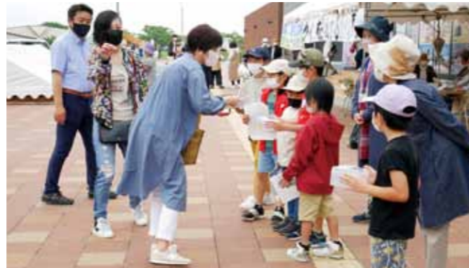
▲道の駅たるみずはまびらでの募金活動の様子

「ウクライナを支援する垂水市民の会」が5月31日をもって活動を終わりました。当会は、ポスターや募金箱等を作成し、街頭や垂水校区振興会連絡協議会を通じて各振興会への募金、署名の呼びかけ活動等に取り組みました。ゴールデンウィークには水之上地区、牛根地区の児童クラブの児童も参加して、道の駅たるみずはまびら等でも署名、募金活動を行い、多くの皆様から署名・募金をいただくことができました。集まった署名と募金は、1日でも早く平和な日常に戻ることを願いウクライナ、ロシアの在日大使館に送付いたしました。