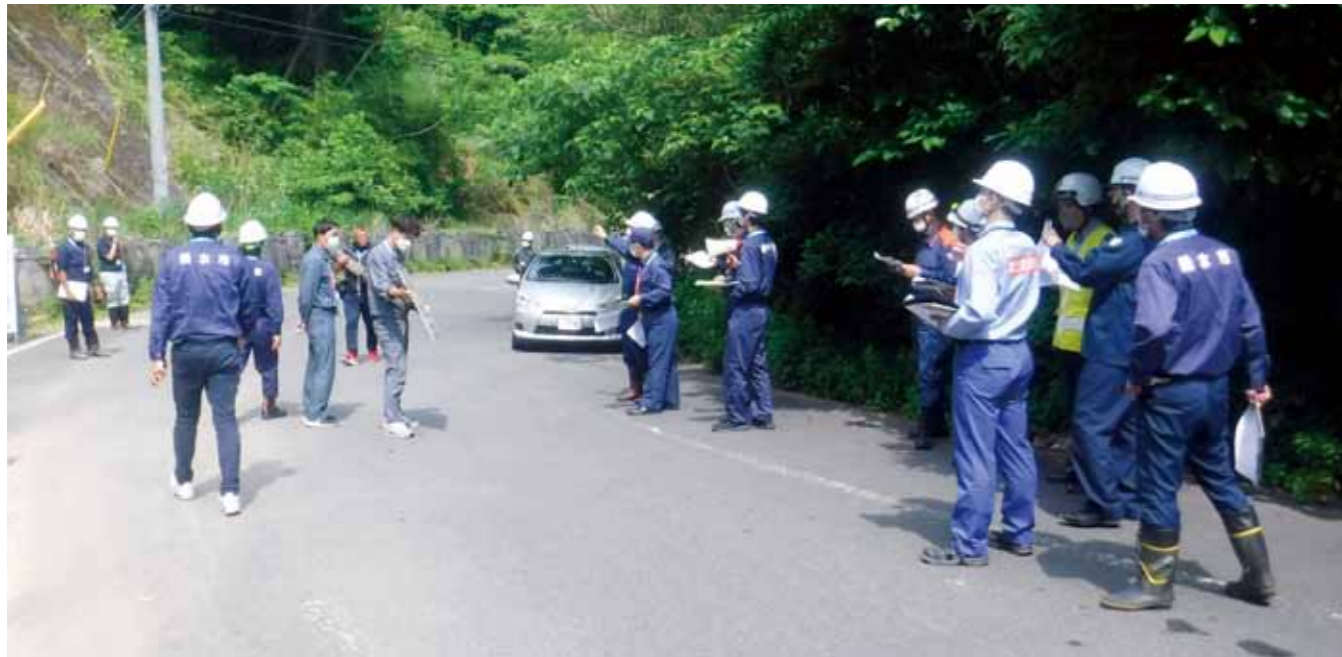
▲防災点検の様子（場所：田神地内）