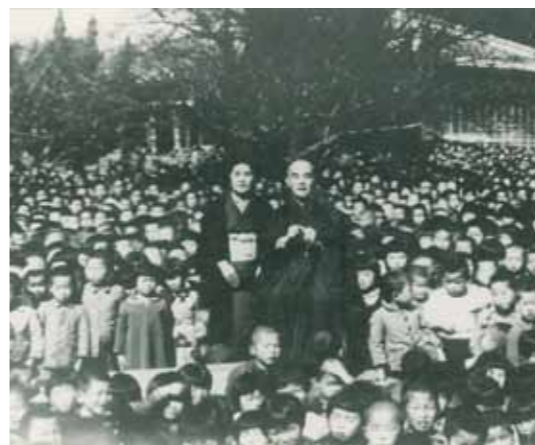
▲昭和13年の帰郷時の様子（垂水小学校で講話をされた。）