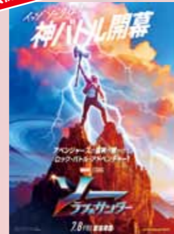
ソー：ラブ&サンダー