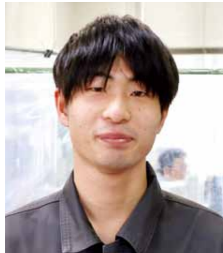
【一般技術職 (土木技師)】

仕事等で分からないことがあれば、上司や先輩方が丁寧に教えてくださるので、働きやすい職場環境です。一緒に知識や技術を磨きながら垂水市のより良いまちづくりに貢献してみませんか。