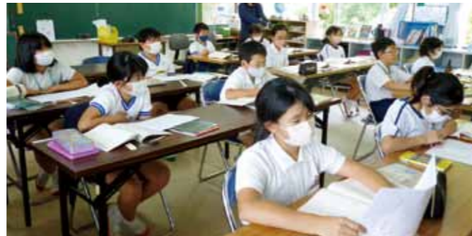
▲4年生の学習の様子