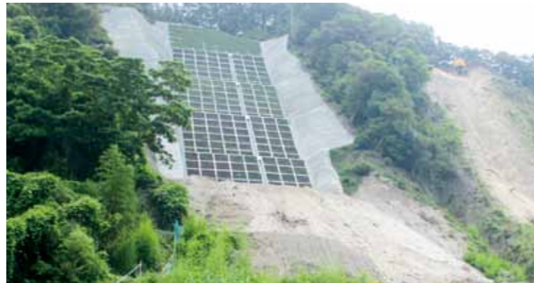
▲災害復旧工事が行われている現場（新城諏訪地区）