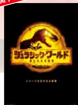
ジュラシック・ワールド 新たなる支配者