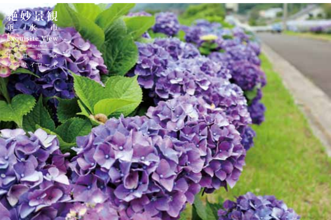
絶妙景観 垂水市 Exquisite View Second season 牛根地区 アンサイロード