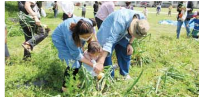
▲力をあわせて、大きな玉ねぎを収穫しました。