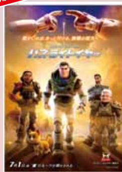
バズ・ライトイヤー