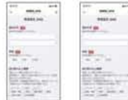
▲受信設定画面のイメージ

※うぶ声・おくやみは、個人情報保護のため、Webページ上では掲載しておりません。 ご了承ください。