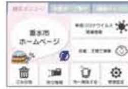
▲総合メニューのイメージ

※受信設定は、総合メニューのシートの右下のアイコンから行うことができます。また、何度でも設定を変更することができます。