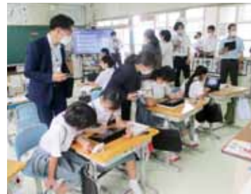
▲新城小学校での研修会の様子

今後、授業を通して研修会を開催し、それぞれの学校の特色を生かしたGIGAスクールの取組が充実させられるようにしていきます。