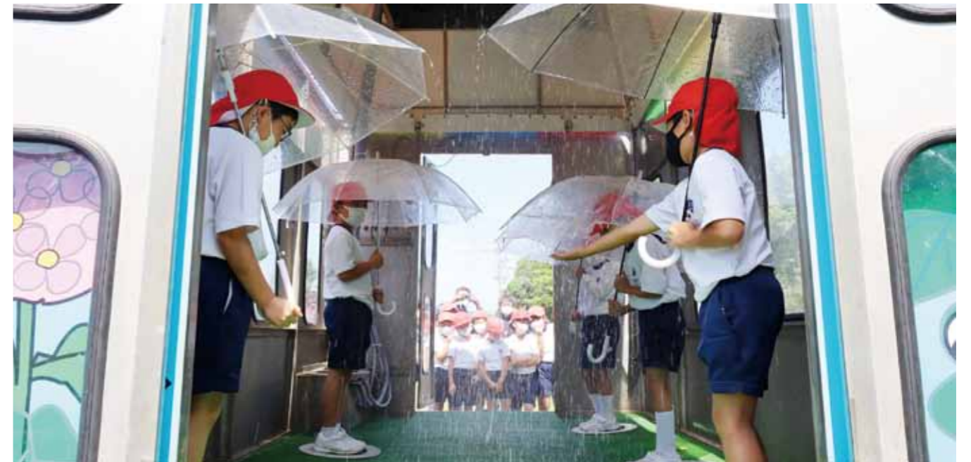
▲降雨体験をする児童。1時間に180ミリの降雨を体験することができました。