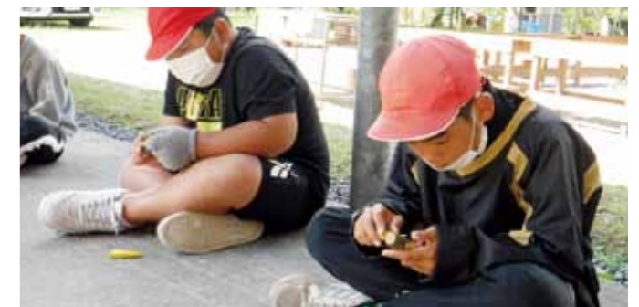
▲小枝でキーホルダーを作っています。