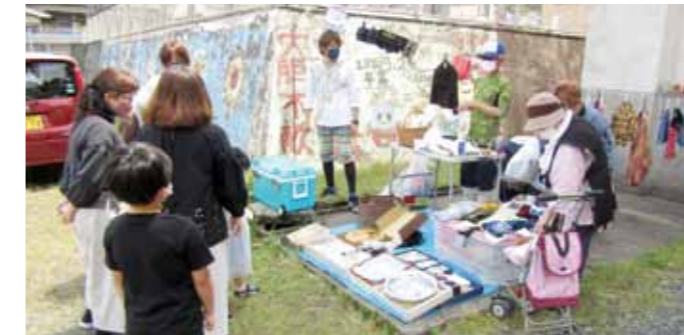
▲フリーマーケットも出店しました。