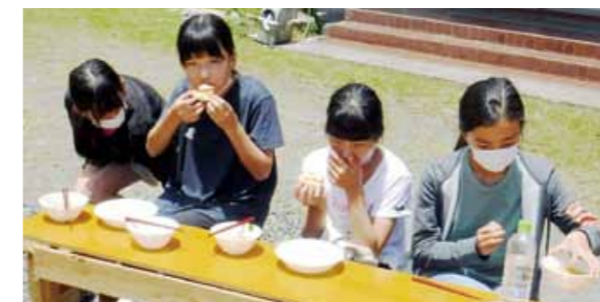
▲野外炊事で作ったピザは美味しかったです。