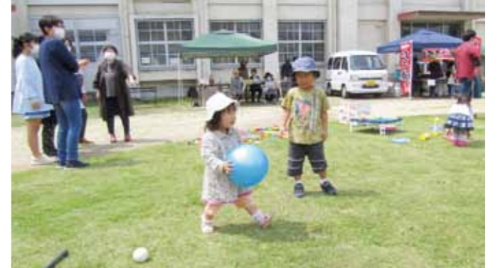
▲広い校庭で楽しくボール遊びをしました。

5月1日、境小学校で境地域交流会「おじゃったもんせ」が開催されました。これは、地域活性化と交流を目的に境地区公民館等が企画したものです。当日は、地域の方々を含め子どもから大人まで130人以上の方が集まり、みんなで校庭を走り回りながら、ボール遊びや輪投げ等を楽しみました。また、野菜畑では旬の玉ねぎの収穫体験もありました。参加者は、「大きな玉ねぎが採れました。とても楽しい1日となりました」と話しました。同交流会は回を重ねるごとに来場者が増えており、地域の活性化が図られています。