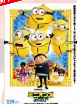
ミニオンズ フィーバー