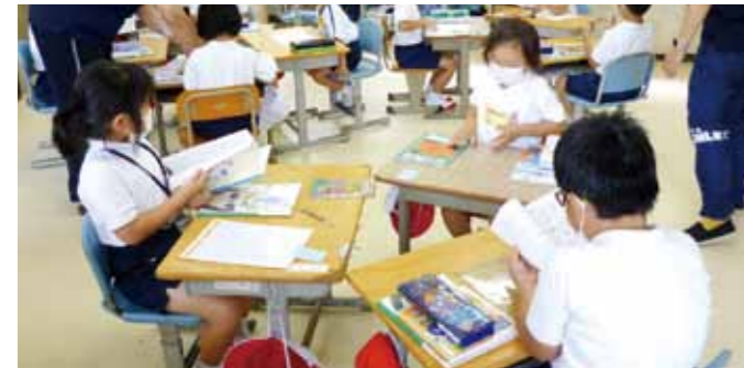
▲1年生のグループ学習の様子