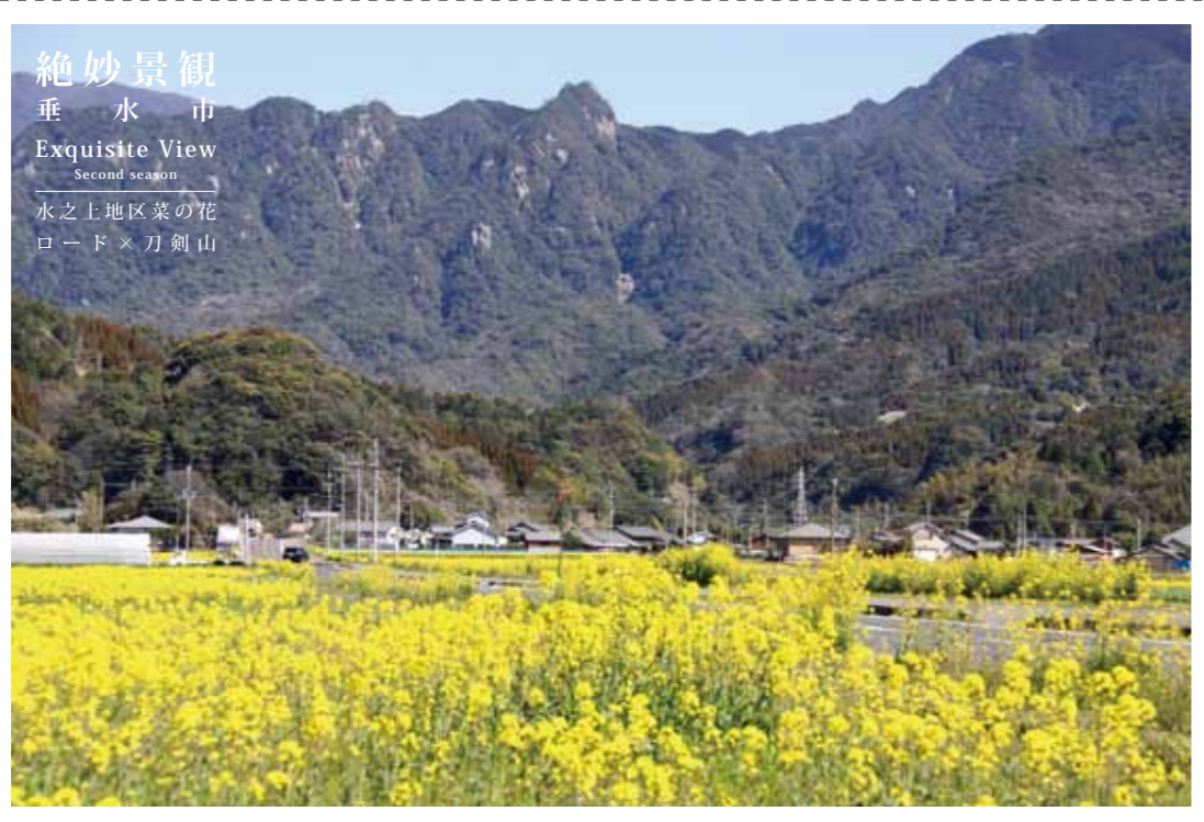
絶妙景観 垂水市 Exquisite View Second season 水之上地区菜の花 ロード×刀剣山