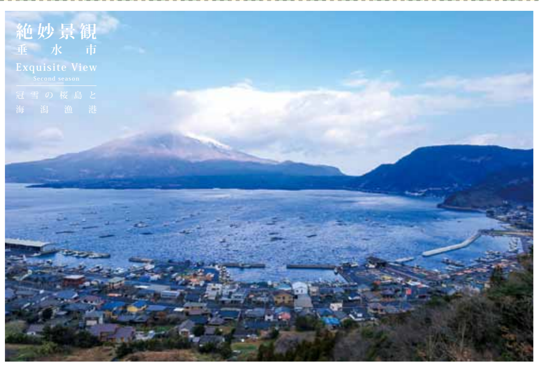
絶妙景観 垂水市 Exquisite View Second season 冠雪の桜島と 海潟漁港