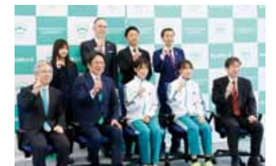
▲ 青山学院大学女子駅伝チーム創設記者会見の様子