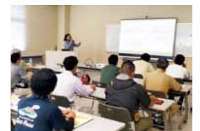
▲ 事業者向け説明会の様子