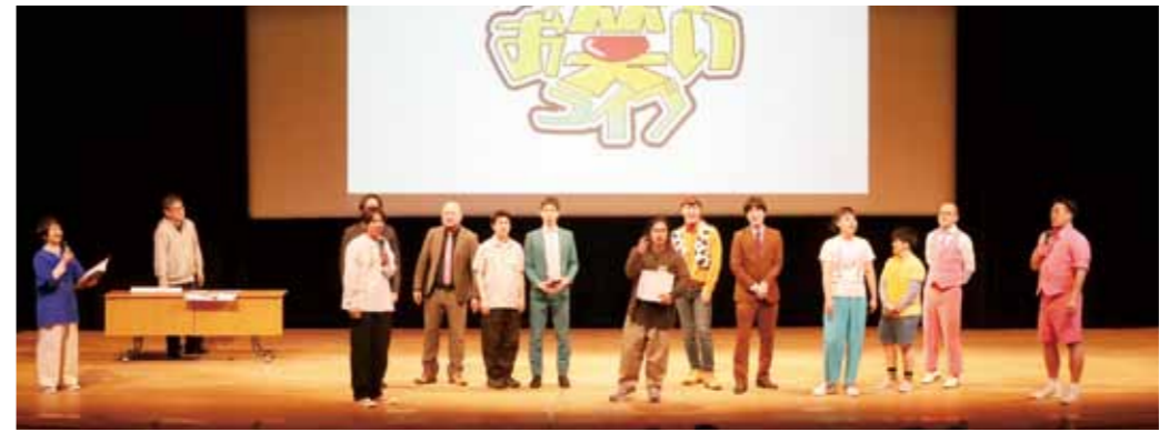
▲ 全員出演の抽選会の様子

令 和8年度垂水市防災点検が4月20日、垂水市の各地で行われました。これは、本格的な梅雨到来を前に、災害危険箇所等を点検する目的で毎年行われるものです。当日は、警察、自衛隊等の関係機関の方々と連携し、市道元垂水原田線の法面防災工事現場、本城川の奇洲除去予定地、椋原小学校裏の治山工事による災害復旧箇所を巡視し、安全状況を確認しました。今後、防災対応力の向上に努め、出水期の対策を徹底してまいります。市民の皆様におかれましては、日頃から防災意識の向上など、引き続きご理解とご協力をお願いいたします。