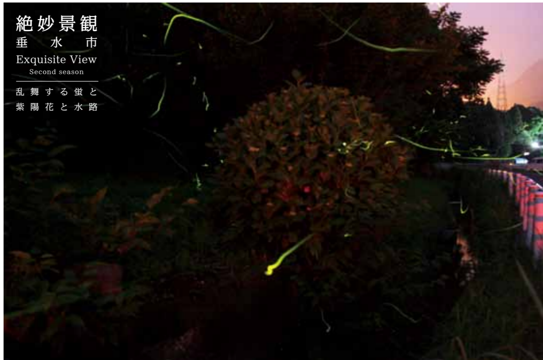
絶妙景観 垂水市 Exquisite View Second season 乱舞する蛍と 紫陽花と水路

平成 28 年度から、垂水市の魅力発信のために、広報たるみずに「ポストカード」をご用意しました！家族や友人、恋人に送って、垂水市の PR にご協力をお願いいたします！