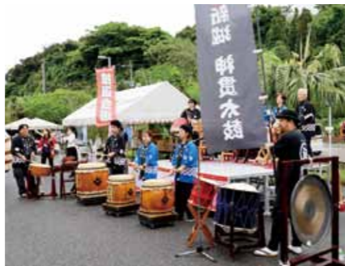
▲ 新城神貫太鼓の皆様