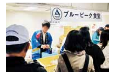
▲ コラボメニュー販売の様子