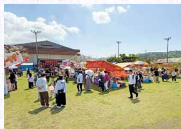
▲ おんだんころら祭りの会場の様子

たるはあく」は、錦江湾に面した桜島と開聞岳が望める道の駅で、1階には、地域の野菜、特産品、お土産品などを販売するマルシェや、本市特産品を使った料理が味わえるレストラン等が設置されています。また、2階には、錦江湾を180度望めるオーシャンビューのカフェと展望デッキがあります。そして、ゆきだるまさんご家族も楽しまれた子ども広場は、高さ10mを誇る本市公式イメージキャラクター「たるたる」がシンボルの大型遊具と、人工芝や砂場など幼児用の遊具が設置されています。本館南側の別棟には、地域の特産品を専門に取り扱う販売所があります。 さらに、同道の駅に隣接する「マリンパークたるみず」では、初心者も楽しめるマリンスポーツとなっており、これからの季節、さらに楽しめる施設となっております。また訪れた際はぜひ、潮風を感じながら、ご家族で笑顔の時間を過ごしていただければと思います。