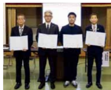
▲ 包括連携協定締結の様子