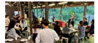
▲フィールドワークの様子