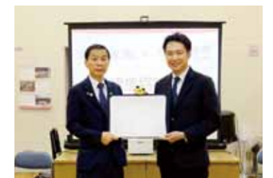
▲ 包括連携協定締結の様子