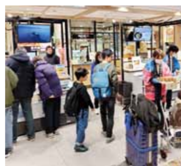
▲羽田産直館の物産展の様子