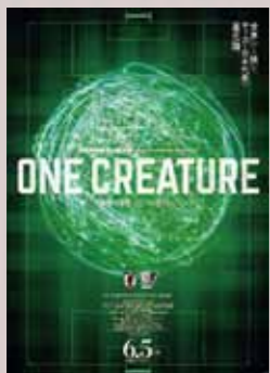
サッカー日本代表映画 ONE CREATURE