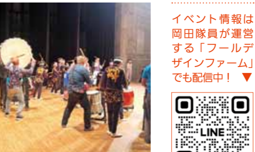
▲太鼓のワークショップの様子