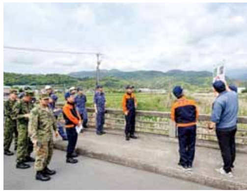
▲ 土木課からの説明を受ける様子