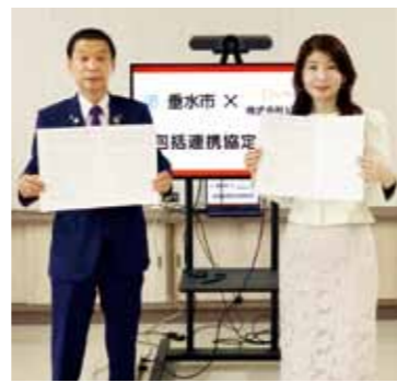
▲ 包括連携協定締結の様子