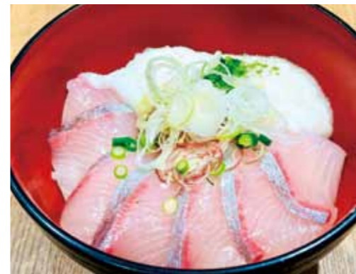
▲ 「海の桜動のとろろ丼」

道 の駅たるみず湯つ足り館のリニューアル記念イベントが4月24日、同道の駅で開催されました。これは、令和8年4月1日から、同道の駅の指定管理者が変わり、物産館やレストランメニュー等がリニューアルされたことに伴い開催されたものです。当日は、新城神貫太鼓の皆様によるお祝いの演奏で始まり、オリジナルエコバッグのプレゼントやガラポン抽選会等の様々なイベントが行われ、多くの来場者で賑わいました。同道の駅は開設21年を迎え、本市の北の観光拠点として約1300万人の来場者を記録しています。