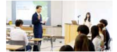
▲成果報告会の様子