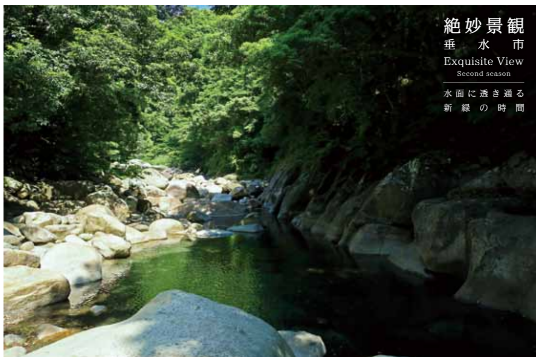
絶妙景観 垂水市 Exquisite View Second season 水面に透き通る 新緑の時間