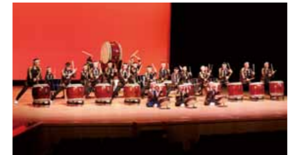
▲和太鼓「輝」の迫力ある演奏の様子