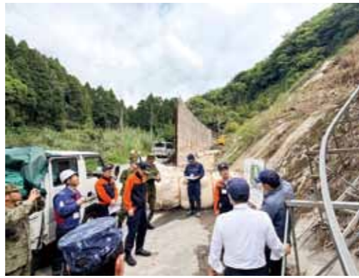
▲ 災害復旧工事現場点検