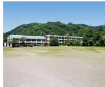
▲ グラウンドゴルフ場