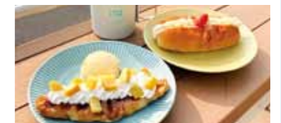
▲開発したメニューの一部