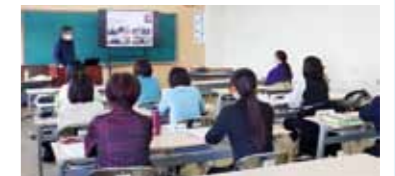
▲学校教育現場での講座の様子