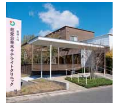
▲ 慈愛会垂水サテライトクリニック