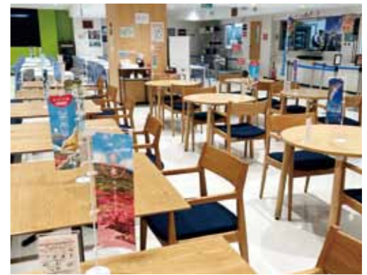
▲ 食堂内には垂水をPRするのぼりが設置されました