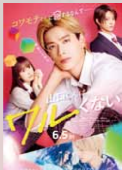
山口くんはワルくない