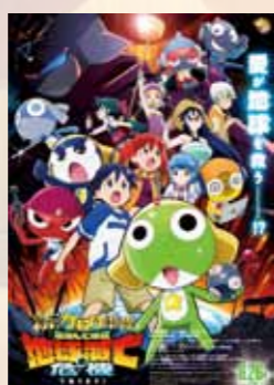
新劇場版☆ケロロ軍曹 復活して 速攻地球滅亡の危機であります！