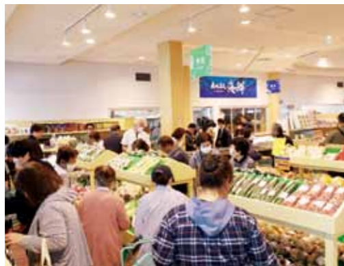
▲ リニューアルされた物産館も賑わっていました

令 和7年度垂水市自主文化事業としてワタナベエンターテインメントお笑いLIVEが3月23日、垂水市文化会館で開催されました。これは、笑いの力で心と体を健やかに保ち、いきいきとした地域づくりを目指す目的で開催されたものです。当日は、ワタナベエンターテインメント所属のちゃんぴおんず、足腰げんき教室、ラパルフェ、豆鉄砲、クマムシ、ロッチの6組がコントや漫才を披露し、約600人の来場者は笑いの渦に包まれていました。今後、地域の活性化に寄与できるようさまざまな文化事業に取り組んでまいります。