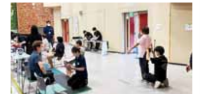
▲健康チェックの様子