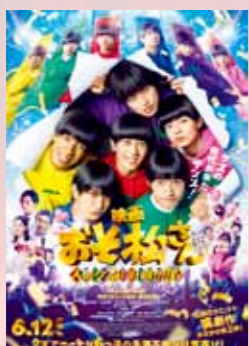
映画 おそ松さん 人類クズ化計画!!!!?