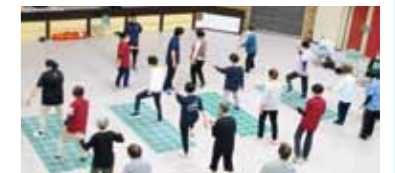
▲はんとけん体操教室の様子