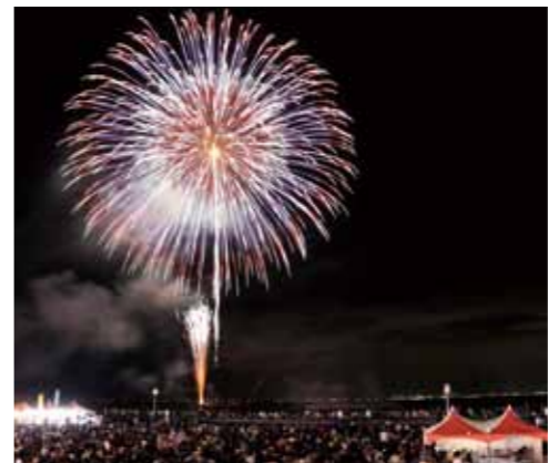
▲打ち上げられた花火と会場の様子