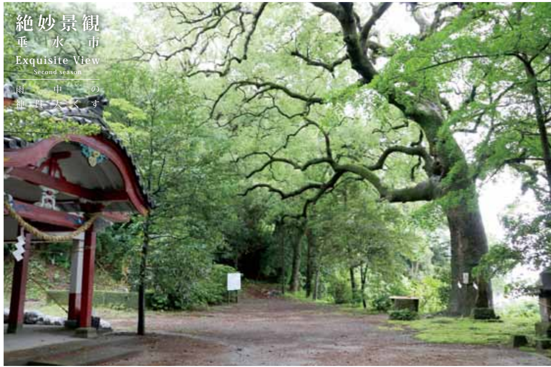
絶妙景観 垂水市 Exquisite View Second season 雨の中の 神宮大くす

平成 28 年度から、垂水市の魅力発信のために、広報たるみずに「ポストカード」をご用意しました！家族や友人、恋人に送って、垂水市のPRにご協力をお願いいたします！