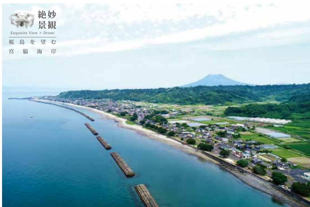
絶妙景観 Exquisite View × Drone 桜島を望む 宮脇海岸