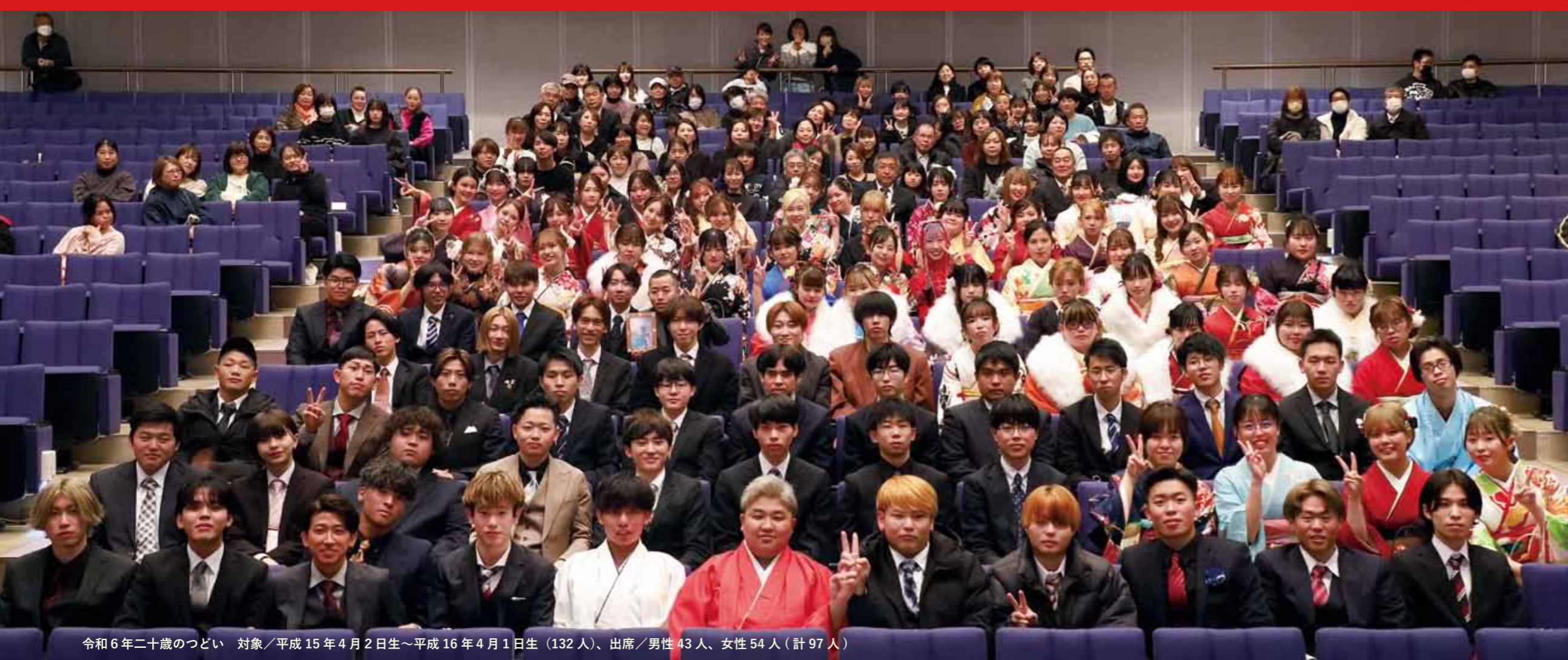
令和6年二十歳のつどい 対象/平成15年4月2日生~平成16年4月1日生(132人)、出席/男性43人、女性54人(計97人)