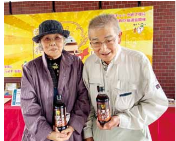
▲商品を受け取った参加者の方