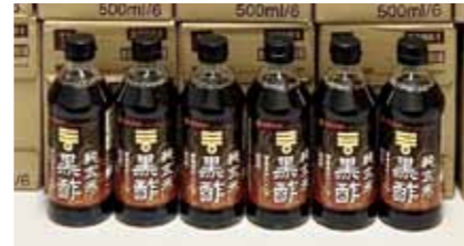
▲「純玄米黒酢 国産玄米100%」

今 年度開催の健康チェックにおいて実施した「お酢に関するアンケート（鹿児島大学心臓血管・高血圧内科学／大石充教授）」において連携