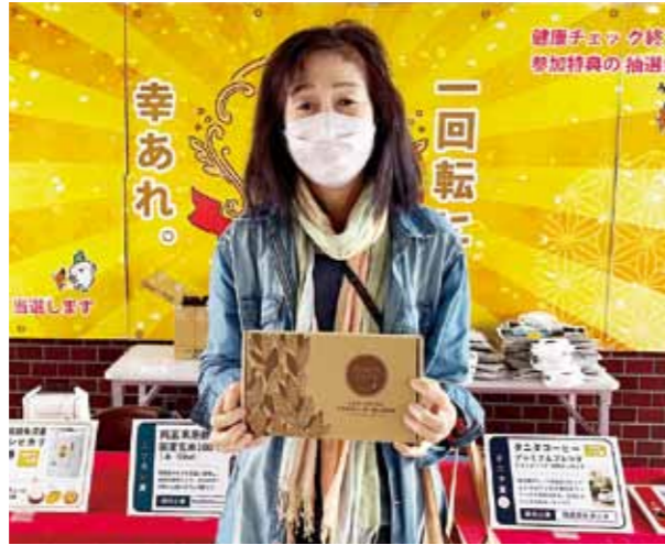
▲商品が当選した参加者