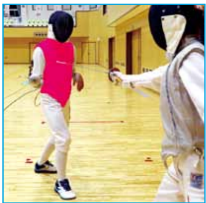
有効面：胴体のみ（背中を含む）