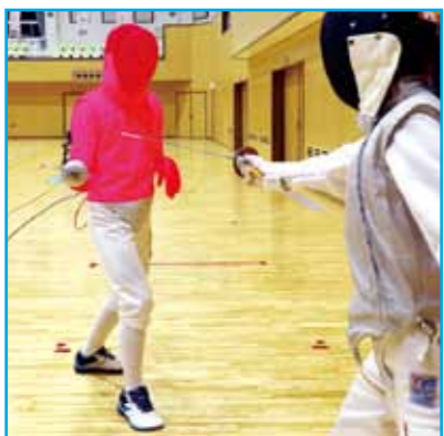
有効面：上半身のみ