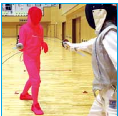
有効面：全身（足の裏も有効）