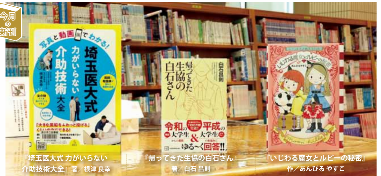
『埼玉医大式 力が足りない 介助技術大全』著/根津良幸