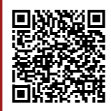
※議会結果はこちらから

※今回の特集は、入稿日が議会の閉会前だったため、5月に開催された施政方針記者会見の資料をもとに作成致しました。議決の結果は反映しておりません。ご了承ください。