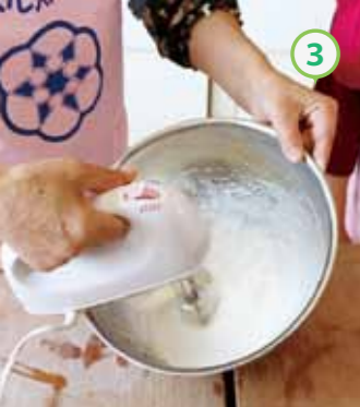
③ ボウルに卵白と残りの上白糖を入れ、ハンドミキサーで角が立つまで泡立てる。