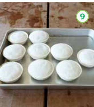
⑨ 氷水をはったバットに⑧を取り出し、荒熱を取れば・・・