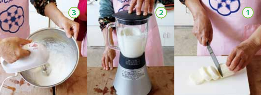
① 長いもの皮をむき、輪切りに切る。