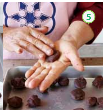
⑤ あんこを18等分に分け、少し平べったく丸める。