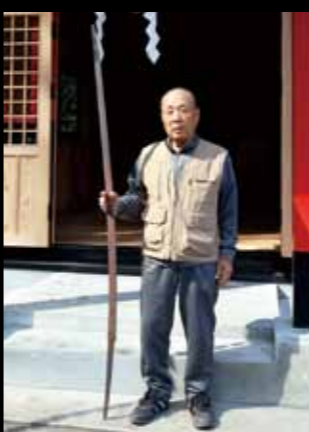
▲荒人神社のご神宝（長刀）