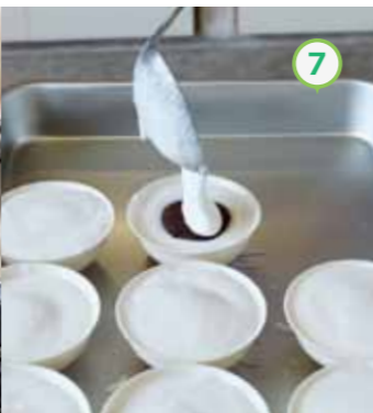
⑦ ⑥のあんこが隠れるように、少量の④をさらに加える。