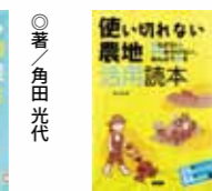
使い切れない 農地活用読本