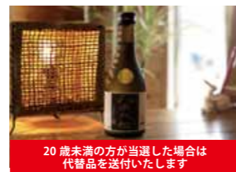
20歳未満の方が当選した場合は代替品を送付いたします

正解者の中から抽選で3名に「八千代伝(黒)300ml」をプレゼントします。当選者の発表は、発送・直接のお届けをもってかえさせていただきます。