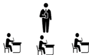
※子供たちが学びとる

例えば、学習問題を解決するために、インターネットや図書、専門家への取材などの調べる活動を自分で選択したり、自分の考えをパワーポイントで説明するなど、様々な方法で表現したりします。また、他者と考えを交流する場面においても、タブレット端末を活用して行ったり、新たな考えを創ったりします。