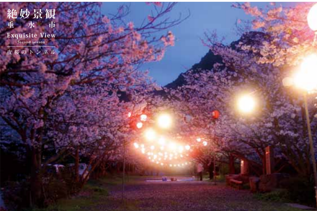
絶妙景観 垂水市 Exquisite View Second season 夜桜のトンネル