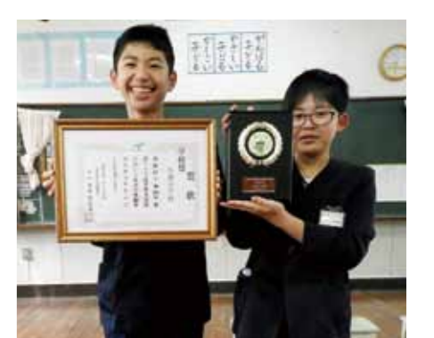
▲学校賞を授与され、笑顔いっぱいの児童たち