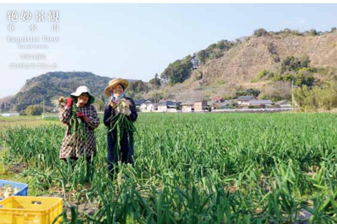
絶妙景観 垂水市 Exquisite View Second season 今年の春も だけがはすごあした