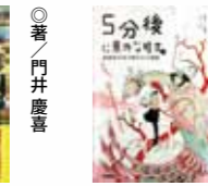
5分後に意外な結末 ex