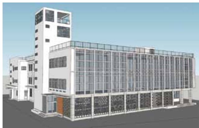
▲耐震補強後の現庁舎のイメージ図 (イメージ図は現時点のものであり、今後の実施設計等により、一部変更となる場合もあります。)