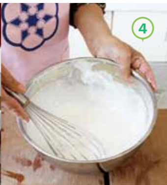
④ ③に②を混ぜ合わせ、ふるいにかけてながら、かるかん粉を入れ、ざっくりと混ぜ合わせる。