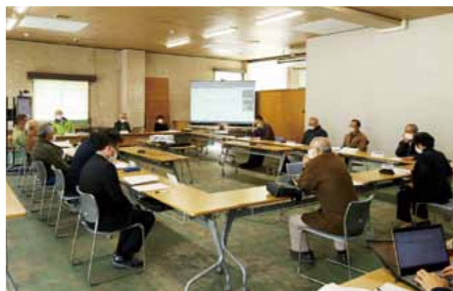
▲第11回垂水市庁舎等のあり方検討委員会の様子

右記のQRコードからこれまでの垂水市庁舎等のあり方検討委員会の活動内容や提出された意見書を見ることができます。