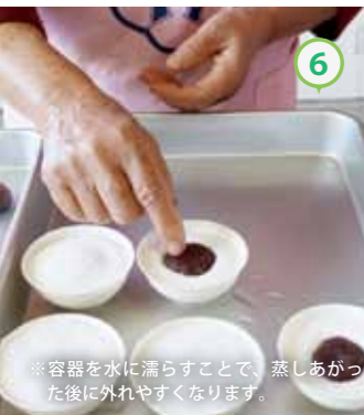
⑥ 水で濡らした容器に④を流し入れ（容器の2/3量が目安）、⑤のあんこを入れる。