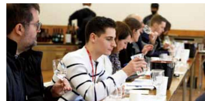
▲同社のお酒をテイスティング