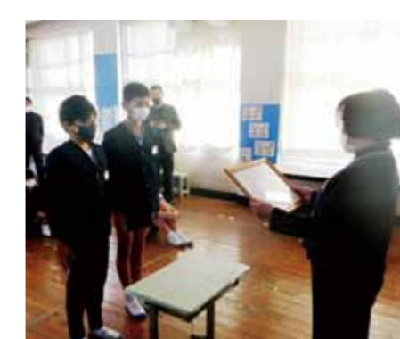
▲牛根小学校で行われた授与式の様子