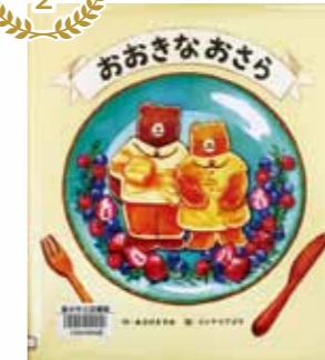
おおきなおさら (あさのますみ)

クマのルウさんの宝物は、だんなさんのムーさんからもらった大きなお皿。ルウさんは家族のためにお皿いっぱいのごちそうを作り、たくさんの幸せな時間を過ごしました。ところが…。