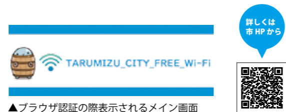
▲ブラウザ認証の際表示されるメイン画面