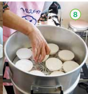
⑧ ⑦を蒸気があがった蒸し器で、10分～13分間強火で蒸す。