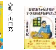
おばあちゃん猫でテーブル を拭きながら言った 一世界のことわざ紀行