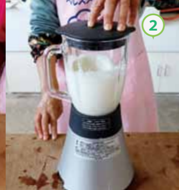
② 長いも、上白糖の半分、水をミキサーにかける。