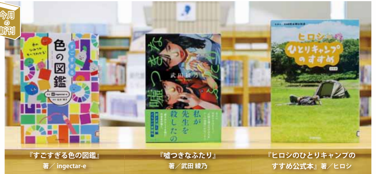
『すごすぎる色の図鑑』 著/ingetar-e