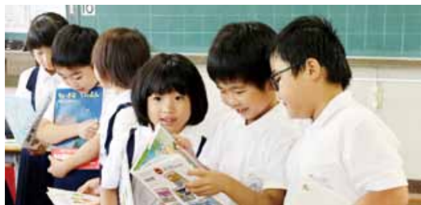
▲昨年の終原小学校で行われた、セカンドブック贈呈の様子

読書習慣のきっかけづくりや、読書をきっかけとした友達づくり、図書館利用促進を目的に、以下の事業で本贈呈を行っています。