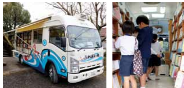
▲移動図書館車（ふれあい号）の外観と中の様子（水之上小学校）