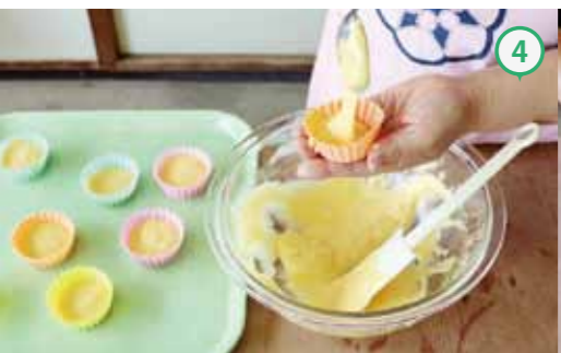
③③をシリコンカップ8個に注ぎ分ける。お好みでレーズンをのせる。