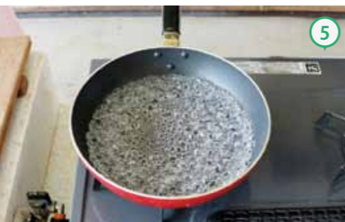
⑥フライパンに水を1cm程度入れ、沸騰させる。