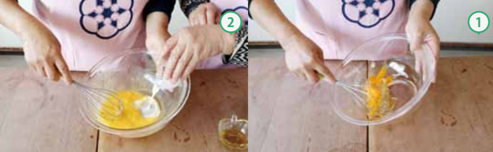
①ボールに卵2個を割り、泡立てる。