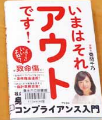
『いまはそれアウトです！』 著/菊間 千乃

車いすユーザーの母、知的障害のある弟、急逝した父…。一生に一度しか起こらないような出来事が、なぜか何度も起きてしまう著者が綴る、笑いと涙の自伝エッセイ。