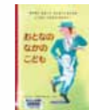
『おとなのなかのこども』 作/ヘンリー・ブラックショア