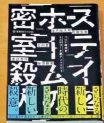
『ステイホームの密室殺人2』 著/乙一