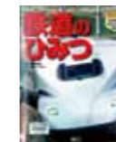
『鉄道のみみつ』 監修/谷藤 克也