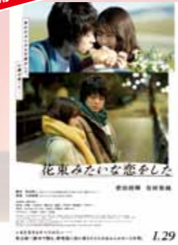
花束みたいな恋をした