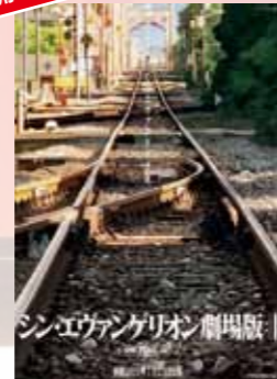
シン・エヴァンゲリオン 劇場版