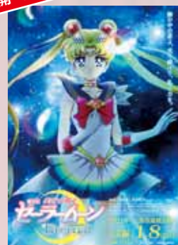
劇場版 美少女戦士セーラームーン Eternal 前編