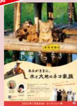
劇場版 岩合光昭の世界ネコ歩き