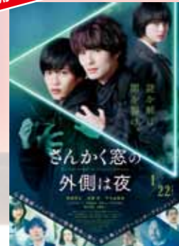
さんかく窓の外側は夜