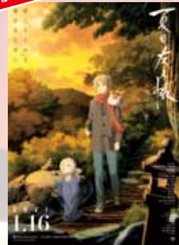
夏目友人帳 石起こしと怪しき来訪者