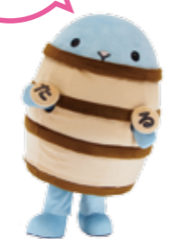
〔表13〕 経常収支比率の推移