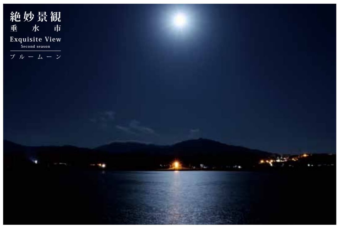
絶妙景観 垂水市 Exquisite View Second season ブルームーン