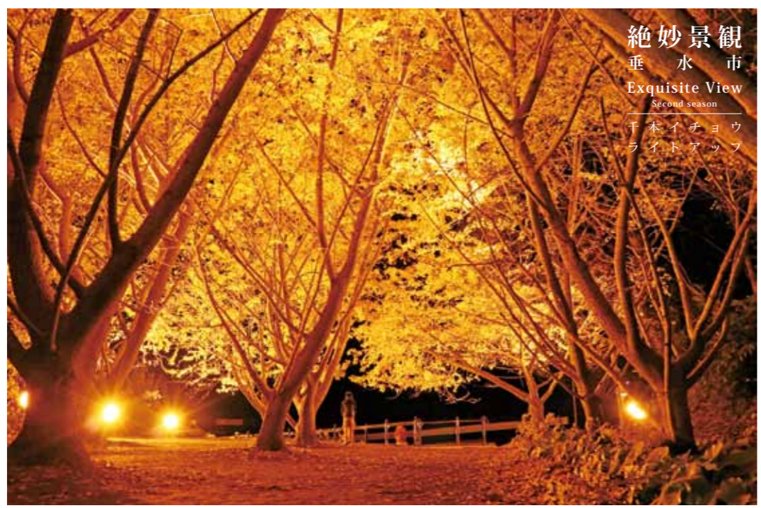
絶妙景観 垂水市 Exquisite View Second season 千本イチョウ ライトアップ