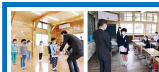
4月21日、さざなみ保育園、垂水小学校でマスクの贈呈式を行いました。