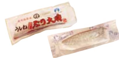
こだわりの鮮魚と牛根漁協「ぶり大将」、垂水市漁協「海の桜鮎」(カンパチ)