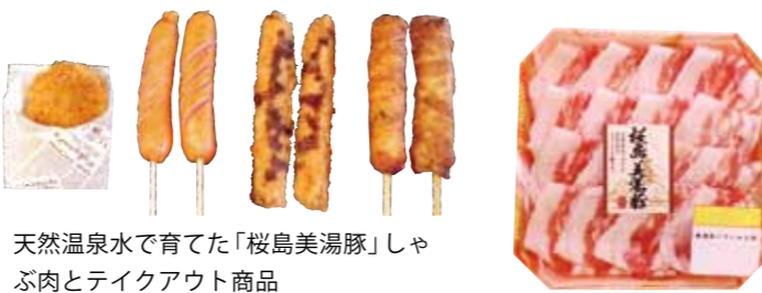
天然温泉水で育てた「桜島美湯豚」しゃぶ肉とテイクアウト商品

本社自慢の桜島美湯豚の商品を皆様に知って、そして味わっていただきたいです。また、垂水市の特産品として地元を盛り上げることができればと思っています。