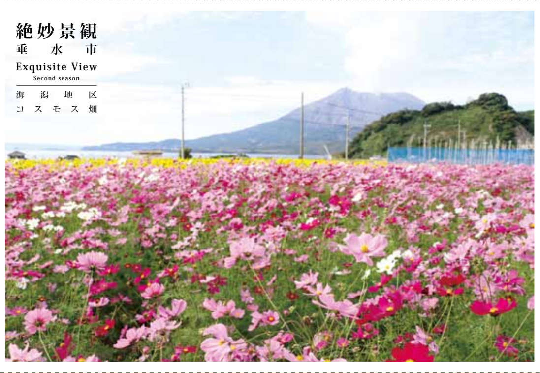
絶妙景観 垂水市 Exquisite View Second season 海潟地区 コスモス畑