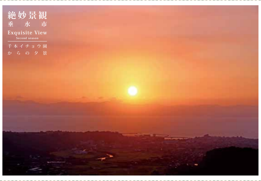
絶妙景観 垂水市 Exquisite View Second season 千本イチョウ園 からの夕景