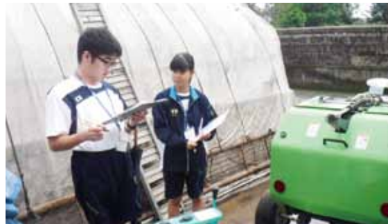
▲現地で機械の調査をする様子

7月10日、11日、垂水高校の2年生2名が就業体験のため市役所を訪れました。1日目は総務課で防災の取組を学び、2日目は、農林課で行っている地産地消推進の取組について広く知ってもらうため、公設市場のせり売りや学校給食における地産地消の取組について学んだほか、直売所「おたけどんの郷」の売上アップのための提案を行う活動を行いました。また、新規就農者を支援する事業で必要な現地調査などにも同行しました。今回の就業体験が、自分たちの就業を考える一助となれば幸いです。