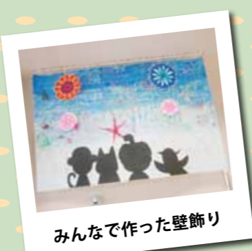
みんなで作った壁飾り

すくすく写真館 インスタ映えコーナーでは、さまざまなグッズや季節にあった小物を自由に使うことができます。