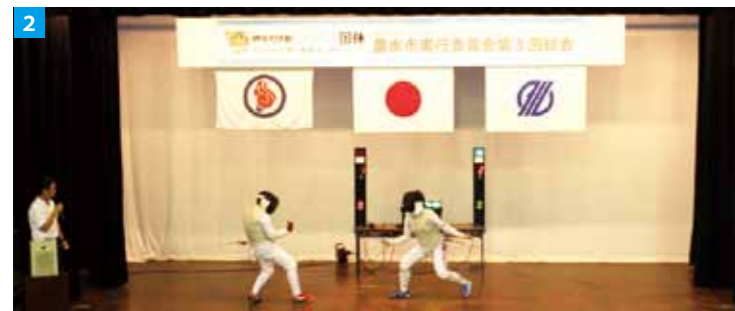
1/第3回総会の様子 2/フェンシング競技の実演