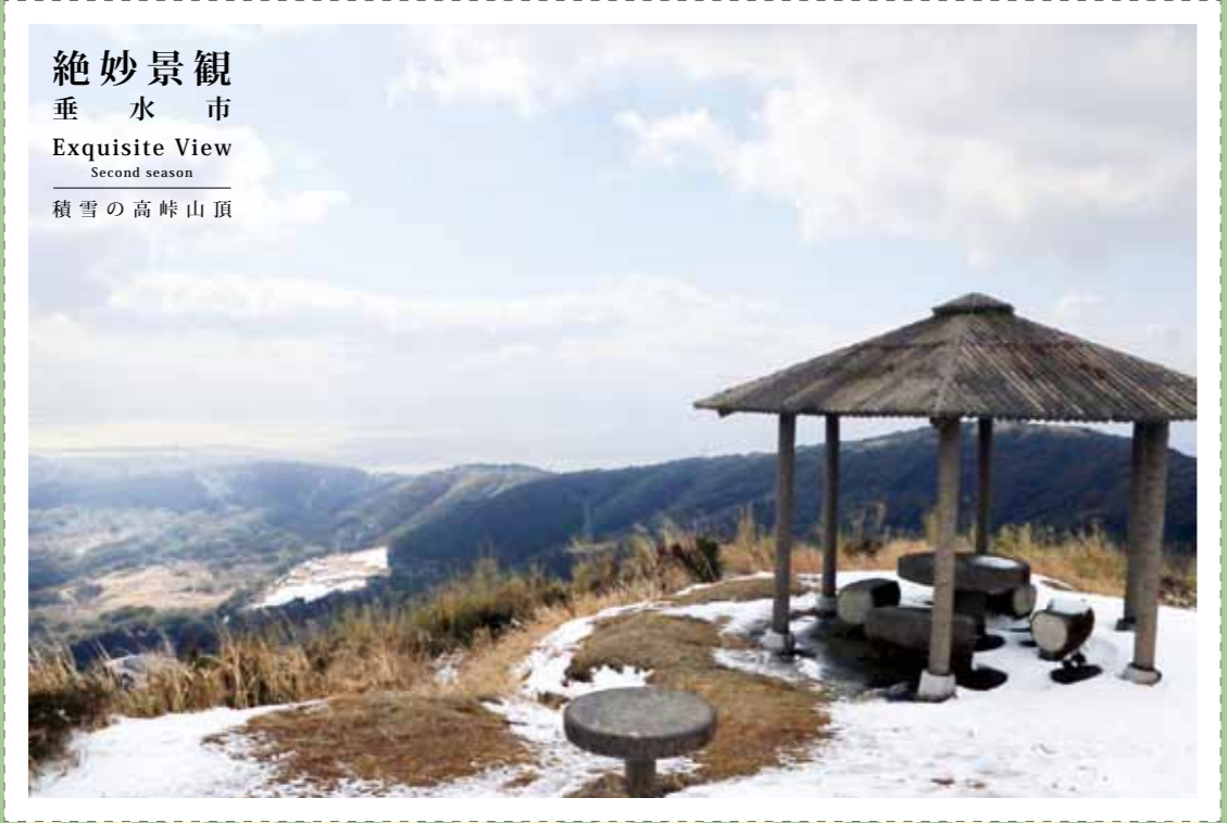
絶妙景観 垂水市 Exquisite View Second season 積雪の高峠山頂