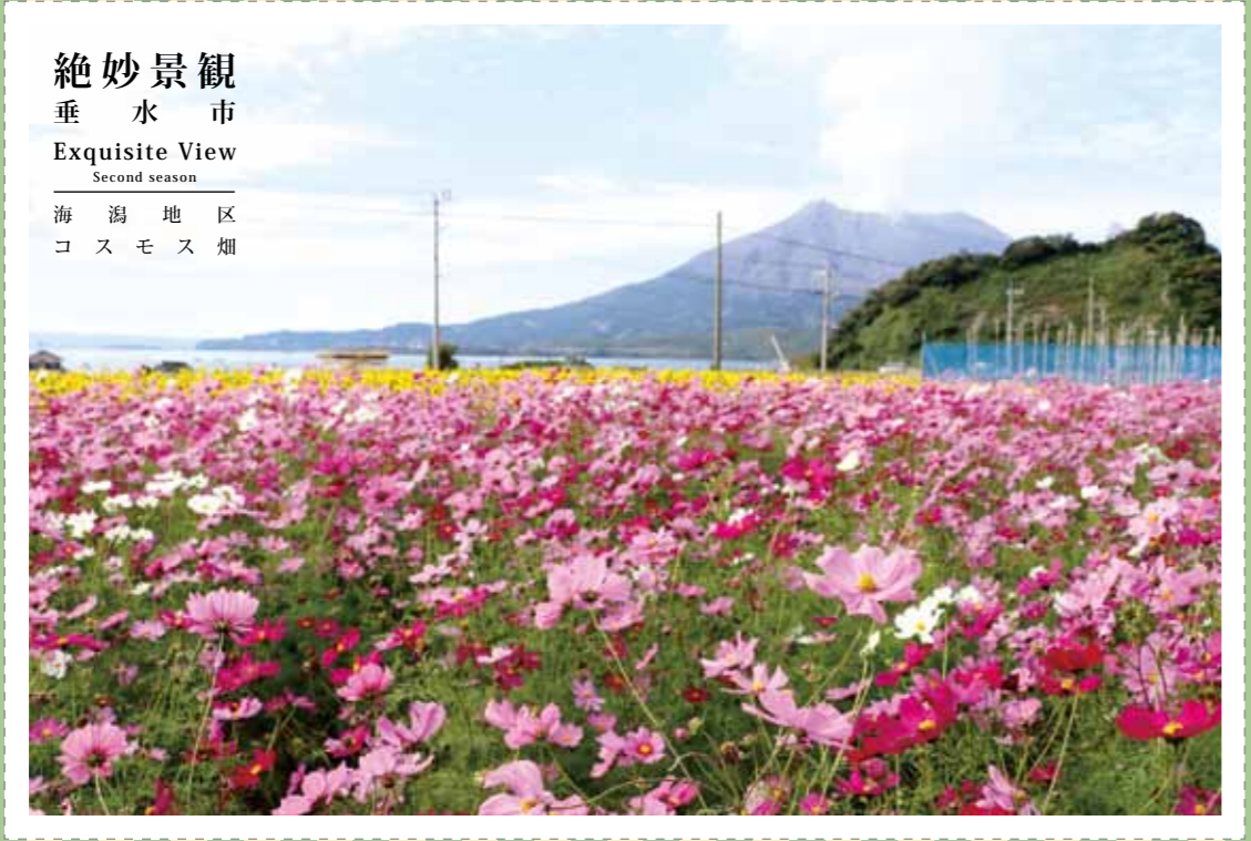
絶妙景観 垂水市 Exquisite View Second season 海潟地区 コスモス畑