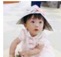
▲かぶとも作ったよ！