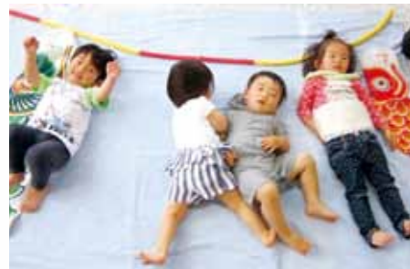
▲こどもの日：お昼寝アート「こいのぼり」