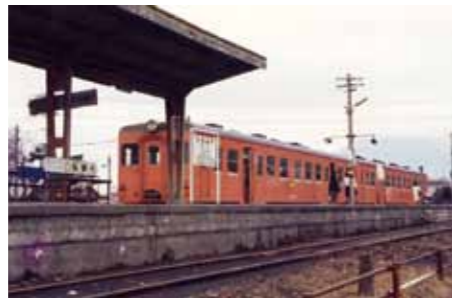
当時利用されていた、駅の様子(昭和62年)

た、昭和57年には、全国高校総体女子バレーボール競技が市体育館開催されました。そんな中、昭和62年3月14日、国分志布志間を結ぶ国鉄大隅線が全線廃止となり、それまでの交通路線はバス路線へと姿を変えていきました。