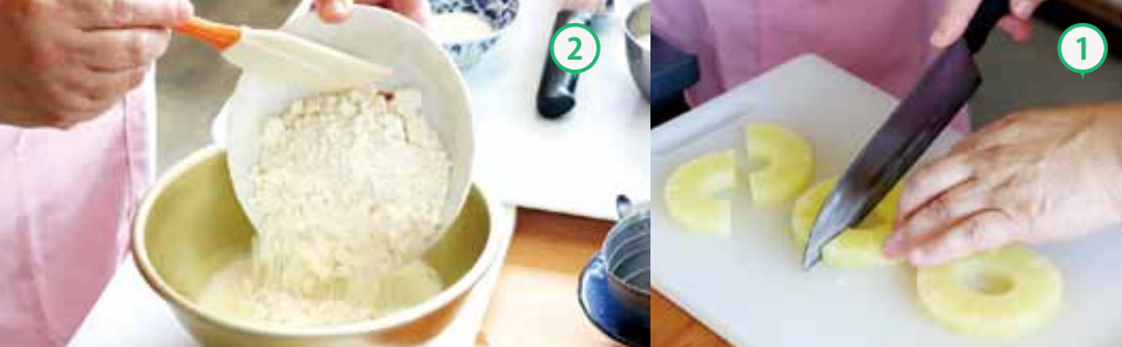
①パイナップルは水気を切り、2枚は半分にカットし、1枚はそのまま使用する。