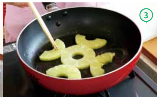
③フライパンにバターを薄く塗り、砂糖を散らし、写真のようにパイナップルを置く。