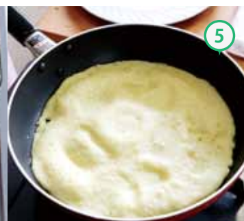
⑤ふたをし、強火で1分、弱火にして5分焼く。