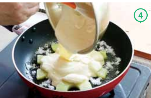
④③の上に、②で作った生地を流し入れる。