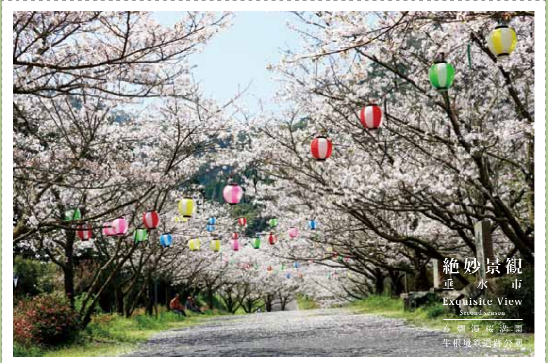
絶妙景観 垂水市 Exquisite View Second season 春爛漫桜満開 牛根境鉄道跡公園