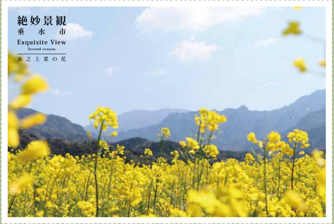
絶妙景観 垂水市 Exquisite View Second season 水之上菜の花