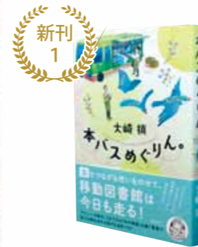
本バスめぐりん。 (大崎 梢)

65歳の新人運転手テルさんと図書館司書ウメちゃん。年の差コンビと3千冊の本をのせて、本バスは今日も走る。巡回先で待ちわびているのは!? ハートフル・ミステリ。『ミステリーズ!』掲載を書籍化。