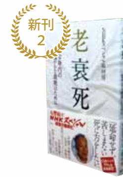
老衰死 (NHKスペシャル取材班)

65歳の新人運転手テルさんと図書館司書ウメちゃん。年の差コンビと3千冊の本をのせて、本バスは今日も走る。巡回先で待ちわびているのは!? ハートフル・ミステリ。『ミステリーズ!』掲載を書籍化。