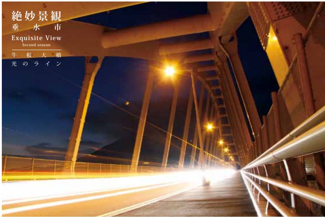
絶妙景観 垂水市 Exquisite View Second season 牛根大橋 光のライン

平成27年2月号に掲載した絶妙景観。夜の牛根大橋です。車のライトが幻想的な空間を作り上げています。