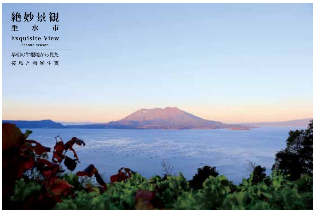
絶妙景観 垂水市 Exquisite View Second season 早朝の牛根境から見た 桜島と養殖生簀