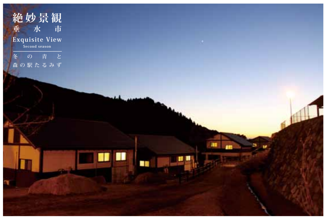
絶妙景観 垂水市 Exquisite View Second season 冬の青と 森の駅たるみず