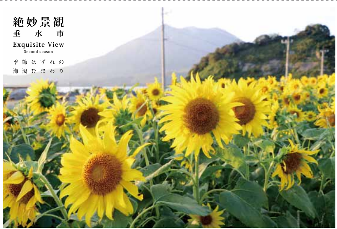
絶妙景観 垂水市 Exquisite View Second season 季節はずれの 海潟ひまわり