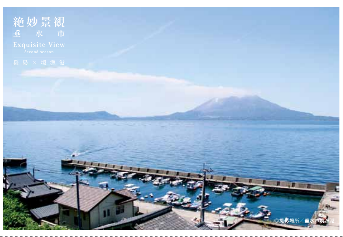
絶妙景観 垂水市 Exquisite View Second season 桜島 × 境漁港