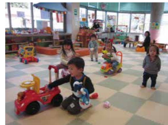
▲子育て支援の様子