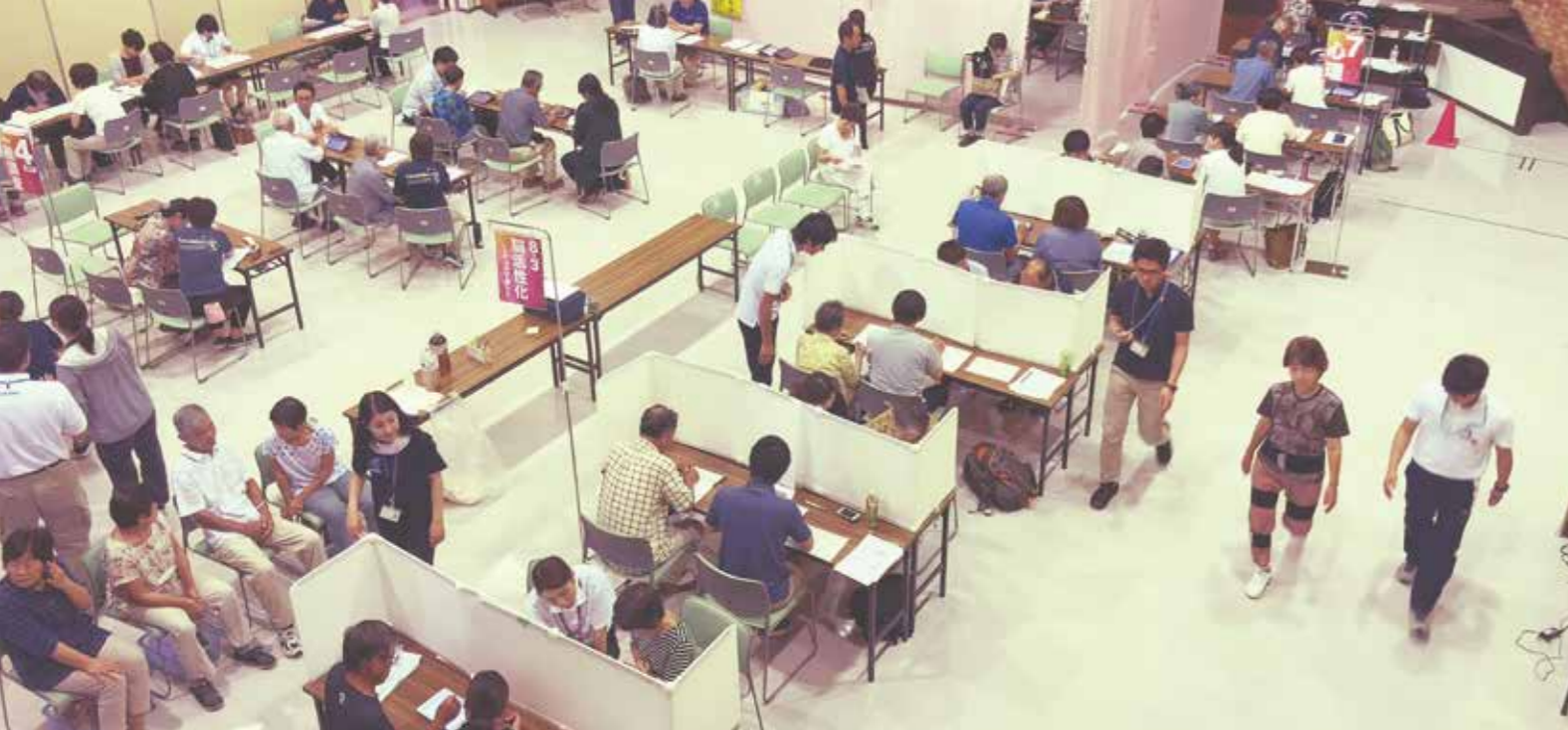
▲市民館開催時の様子