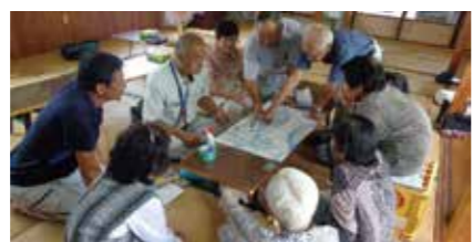
▲生活支援コーディネータによる生活支援事業