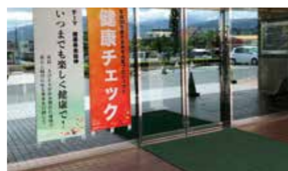
▲健康プロジェクト会場