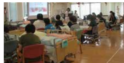
▲介護職員の地域リハ講習会