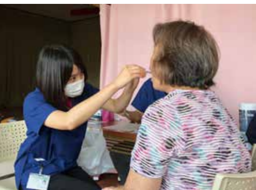
▲歯科調査（口腔機能）の様子

「たるみず元気プロジェクト」は、鹿児島大学と共同で「健康長寿・子育て支援」の新しいモデルケースを構築するプロジェクトとして平成29年度からスタートしています。 まず「健康長寿」面からのアプローチとして、垂水市の高齢者等の健康増進・介護予防を推進するとともに、事業を継続することにより医療・介護職の人材確保につなげることを目的とした「健康チェック」を実施し、平成29年度はプレイロット事業として65歳以上の方を対象に380名、平成30年度は、本格スタートとして40歳以上の方を対象に、1,151名の参加があり、その結果をもとに、健康教室等も実施しています。 「健康チェック」のテーマは、「高齢者の生活機能や身体状況、運動習慣が生命予後にどのように関与しているか」とし、体と脳の健康度や口腔、栄養、心電図など多分野を一度にチェックできる内容となっています。