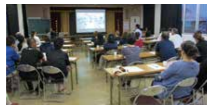
▲認知症サポーター養成講座

地域包括ケアシステムの 実現へ向けて 地域包括支援センターの充実 高齢者が可能な限り住み慣れた地域で、自分らしい暮らしを人生の最後まで続けることができるよう、地域の包括的な支援・サービス（医療・介護・予防・住まい・生活支援）の提供体制である地域包括ケアシステムの構築を推進しています。