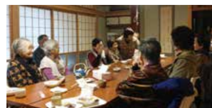
▲生活支援コーディネータによるサロン