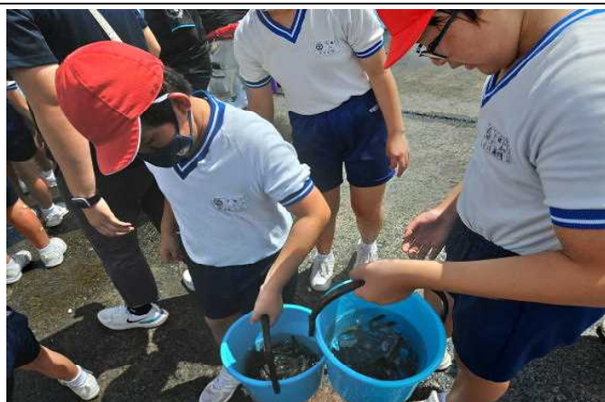
【⑤（いよいよ稚魚放流）】