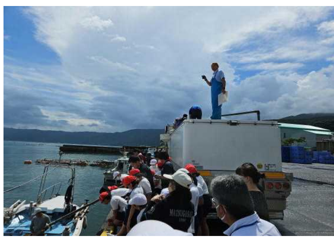
【①（トラックから漁船に稚魚を移す）】

○ 7月12日（水）に真鯛の稚魚放流体験を行いました。牛根漁協の方々に協力をいただき、松ケ崎小、牛根小の児童が真鯛稚魚約3万3千匹を放流しました。子供たちは、バケツに稚魚を入れてもらい、港の岸壁から「大きくなってね。」と願いを込めて放流しました。豊かな海に囲まれた垂水市だからできる海の資源を守り育てる活動です。1年後には、約5cmの稚魚が約30cmの美味しい塩焼サイズに成長するそうです。貴重な栽培漁業体験となりました。