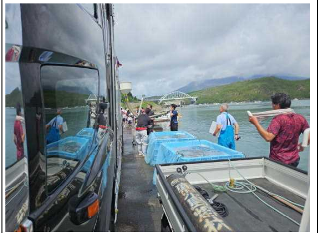
【②（いけすに移した稚魚）】