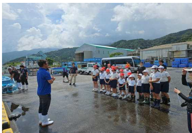
【③（稚魚放流学習の説明）】