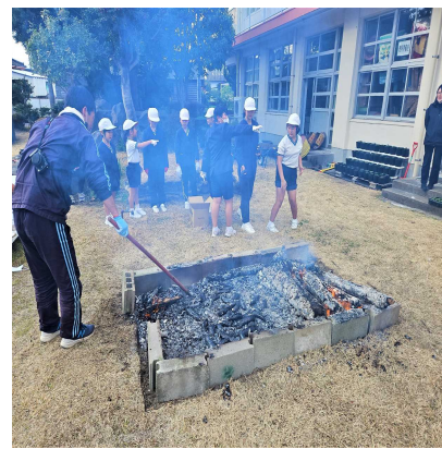
【芋を入れ終わりました♪】