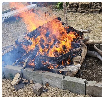
【流木を薪にして準備中♪】

○ 1月12日（金）の5時間目に、全校児童で焼き芋パーティーをしました。5・6年生が総合的な学習の時間に二川海岸で集めた流木を薪として、学校の農園で育てた芋を焼き芋にしてみました。寒いこの季節は、焼き芋にぴったりです。子供たちも職員も、できたての焼き芋を食べてホッコリした気持ちになりました。楽しい癒やしの時間となりました。