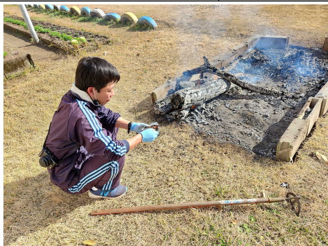
【焼き芋大将の試食タイム♪】