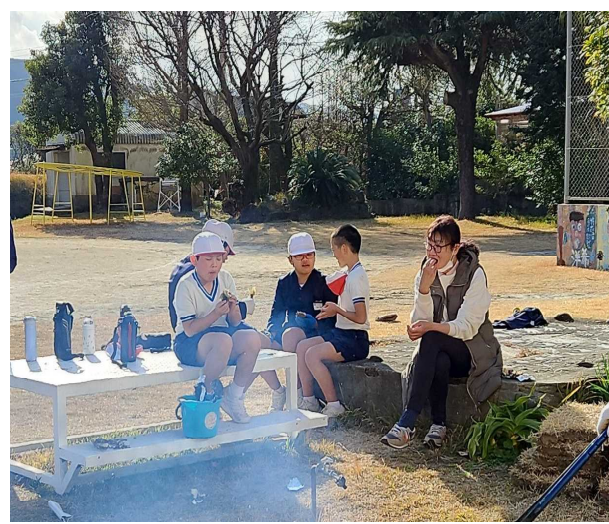
【ホクホク甘くて美味しい♪】