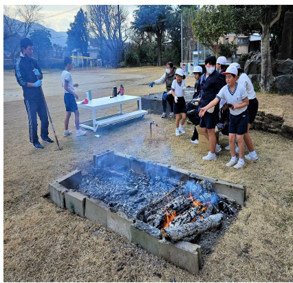
【おいしい芋になれ♪】