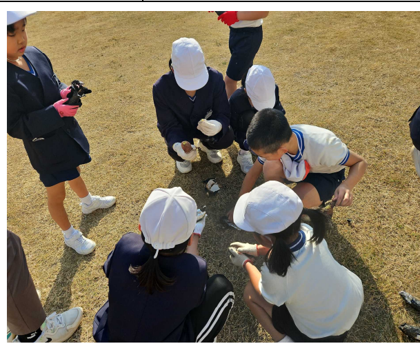
【どのお芋にしようかな？試食タイム♪】