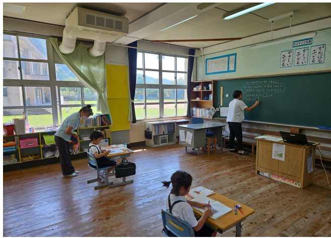
【1年算数（今日のめあては・・・。）】

○ 9月7日（木）に行われた，授業参観では，1年生は10より大きい数の数え方を10のまとまりで考えることができました。3・4年生は，敬老の日を送るはがきをおじいちゃんやおばあちゃんを思い浮かべながら心を込めて書きました。5年生は，多角形の内角の和を三角形の内角の和をもとに求めました。6年生は，点対称の図形の問題を友達と協力しながら解いていました。保護者の方々が参観してくださり，いつも以上に張り切って取り組んでいました。