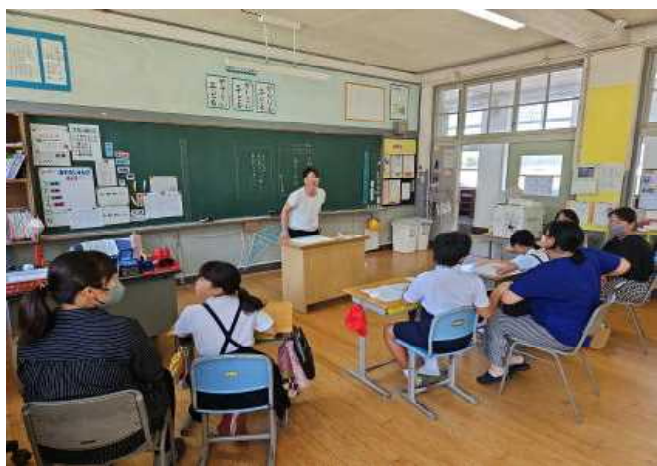
【3・4年書写（今日は，敬老の日のはがきを書きます。）】