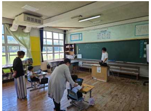
【1年算数（どう？できそう？）】