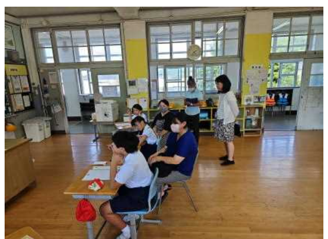
【3・4年書写（おじいちゃんになんて書こうかな？）】