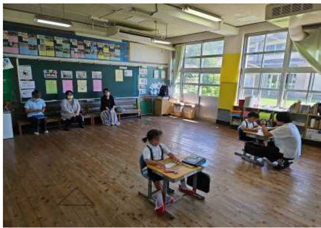
【1年算数（この問題は，まず10こ数えて）】