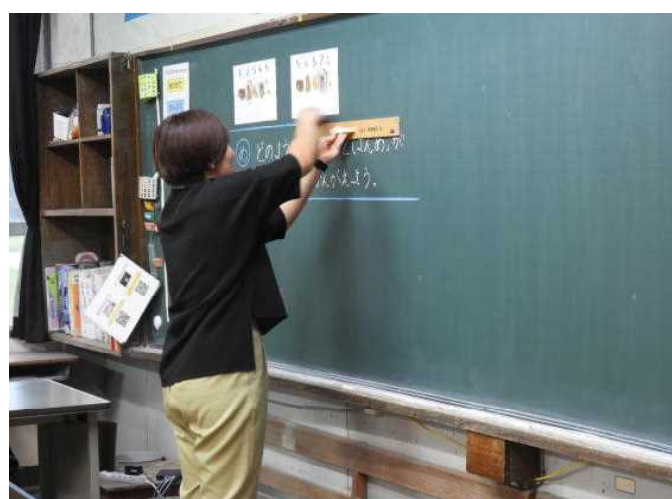
【授業参観① (1年生算数)】

○ 7月3日(月)に、市教委学校訪問がありました。5時間目に授業参観をしていただきました。子供たちは、緊張しながらも張り切って一生懸命に取り組んでいました。全学年がタブレット端末を活用した授業の様子を見ていただきました。授業に集中して取り組む姿をお褒めいただきました。これからも、文房具の一つとして、タブレットを活用していきます。