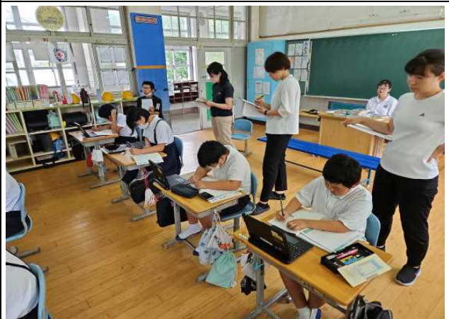
【ノートに考えをまとめる④】