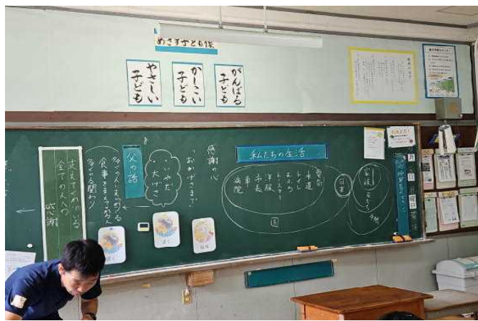
【黒板に感謝についてまとめる⑤】