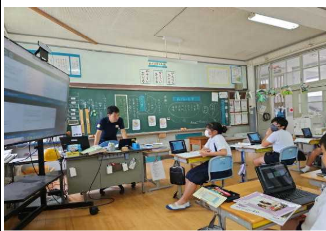
【まどみちおさんの「朝がくると」を聞く⑥】