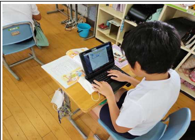
【自分の考えをロイロノートに打つ②】