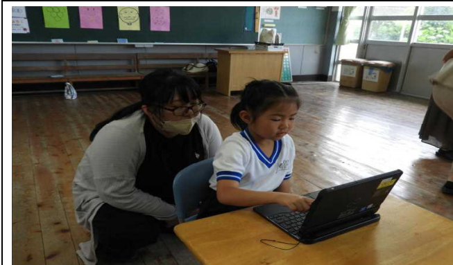
【授業参観⑤ 1年 (算数)】