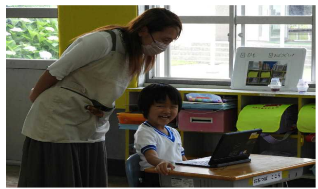
【授業参観④ 1年 (算数)】