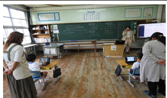
【授業参観⑥ 1年 (算数)】