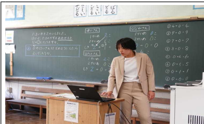
【授業参観① 1年 (算数)】

5月28日(日)に日曜参観を行いました。授業参観、親子で学ぶ歯の健康教室、親子で製作(かかしづくり)を行いました。授業参観では1年生は、算数で「0の計算」についての学習、3・4年生は国語で「ロイロで家族紹介」をする学習、5・6年生は国語で「俳句」の発表を行いました。どの学年でも、タブレット端末を使用し、ロイロノートの提出機能を活用する学習でした。1年生も、入学して2ヶ月とは思えないほど、タブレット端末を文房具の一つとして使っていました。 親子で学ぶ歯の健康教室では、カラーテスターを使った歯磨き指導を今年も行いました。子供たちは、磨き残しの部分の歯がピンクに染まった歯を丁寧に磨きながら、正しい歯磨きの仕方を教わりました。今年も御指導ありがとうございます。 親子製作のかかしづくりでは、「スプラトゥーン」のキャラクターを作りました。保護者が事前に準備してくださったパーツを切ったり塗ったりくっつけたりして完成させました。今年も交通安全を祈願して、牛根支所前の道路に設置します。交通ルールは、守らないとイカンですよ。