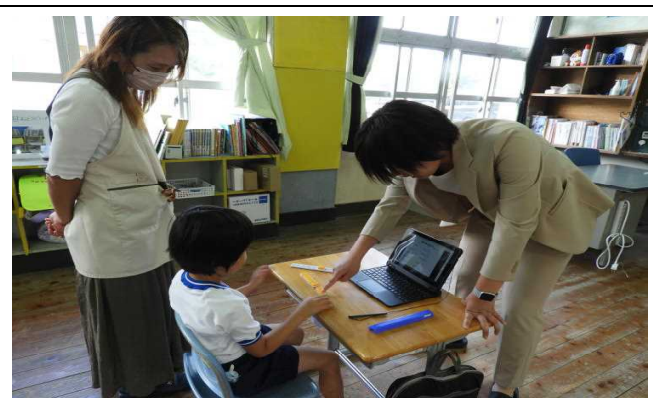
【授業参観② 1年 (算数)】