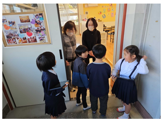
【「ここは、児童クラブです。」】