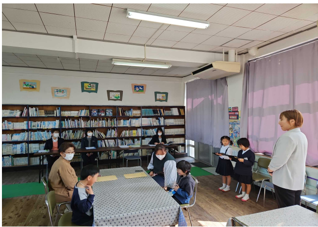
【入学説明会「始めの言葉」】

○ 2月6日（火）に、入学説明会がありました。1年生2人がお姉さんとして、新1年生に校内の施設をタブレットを使い、丁寧に説明していました。ロイロノートを使い、絵本の読み聞かせをしたり、新聞紙を使ったジャンケンゲームをしたりしました。タブレット端末で、学習ドリル（Nabima）を体験させることで、小学校入学への意欲づけを行うことができましたようです。