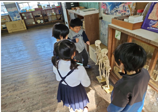
【「ここは、理科室です。」】