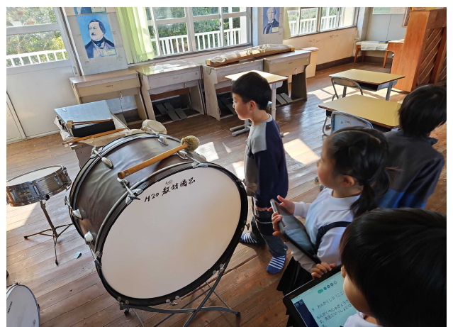
【「ここは、音楽室です。」】