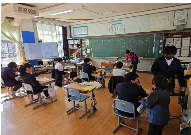
【「ここは、5・6年教室です。」】